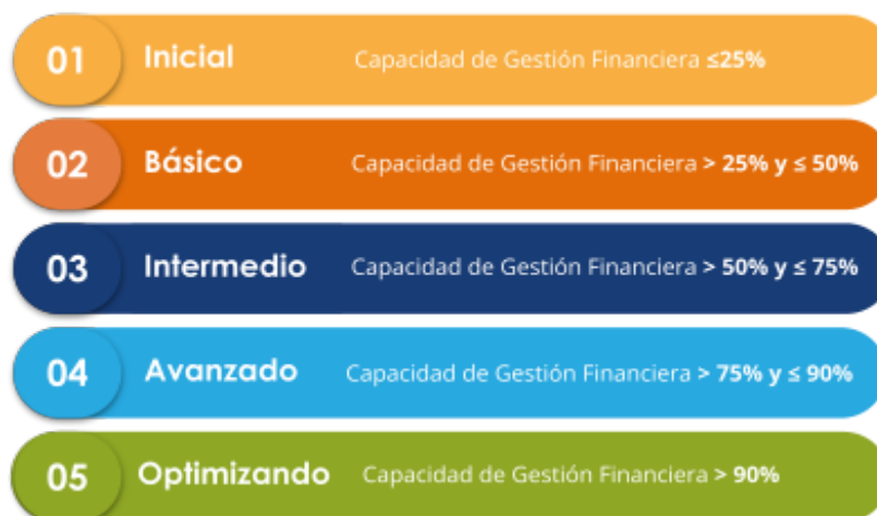
Figura 3: Niveles de capacidad de gestión financiera