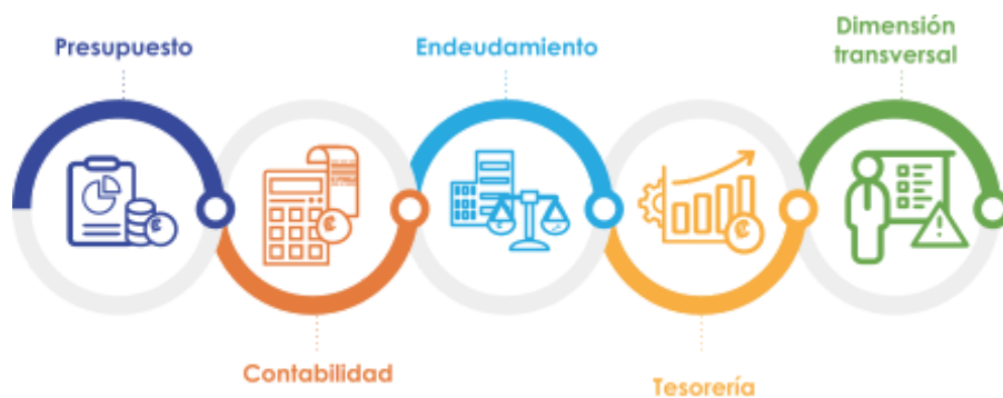
Figura 1: Dimensiones del ICGF

El ICGF se compone de 4 dimensiones basadas en los procesos de gestión financiera, a saber: Presupuesto, Contabilidad, Endeudamiento y Tesorería, así como, una dimensión transversal con elementos complementarios vinculados a esa gestión.