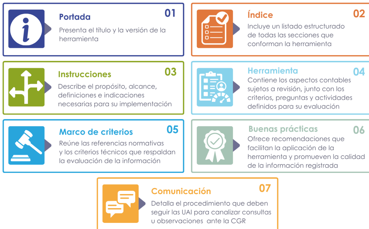
Figura n.º 4. Estructura de las herramientas asociadas a la guía

Adicionalmente, cada herramienta está estructurada en siete secciones, diseñadas para guiar de manera clara y sistemática la revisión de información contable. El detalle de la estructura de cada herramienta se presenta a continuación: