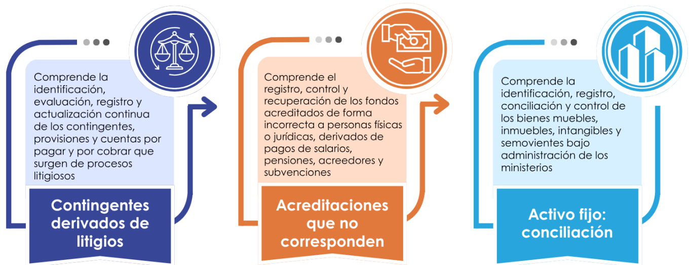
Figura n.º 3. Aspectos de revisión por parte de las UAI de los componentes seleccionados