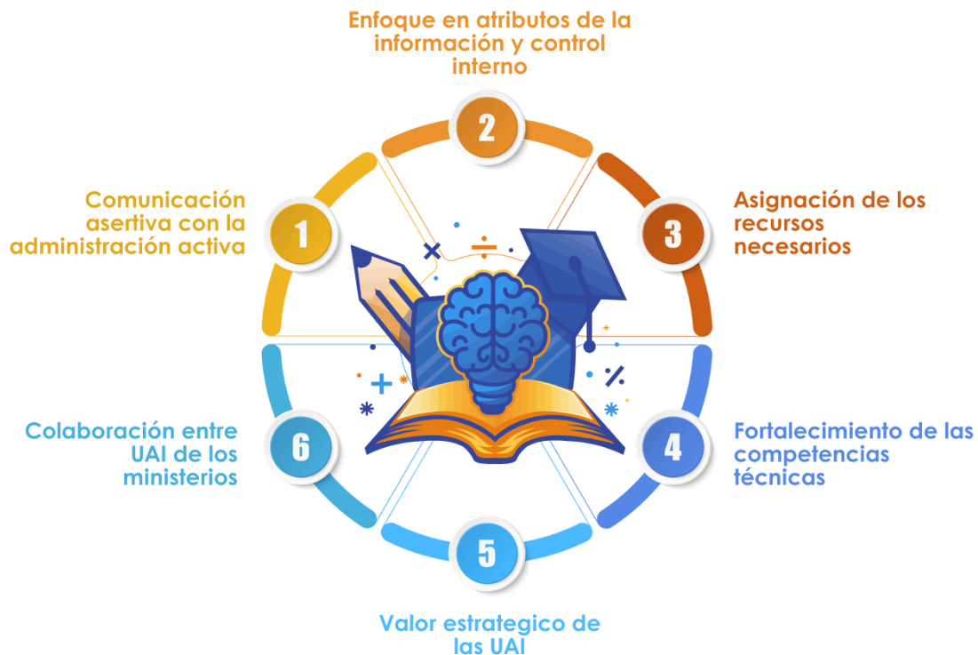
Figura n.º 5. Sanas prácticas y aprendizajes

La experiencia derivada del desarrollo y aplicación de esta guía ha permitido identificar un conjunto de sanas prácticas y aprendizajes que fortalecen el rol de las UAI en la mejora de la gestión pública y en la generación de valor institucional: