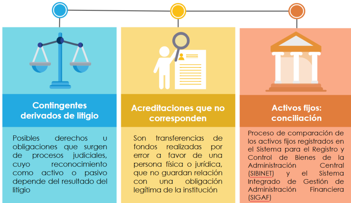
Figura n.º 1. Componentes abordados en la guía

Las instituciones del sector público costarricense que se encuentran bajo el ámbito de rectoría técnica de la DGCN tienen la responsabilidad de generar y reportar información contable periódica. En este marco, los Ministerios, como Unidades de Registro Primario (URP), aportan información esencial a la DGCN para la elaboración de los EEFF del PE. Entre las labores que realizan en materia contable se encuentra el registro y control relacionado con los siguientes componentes: