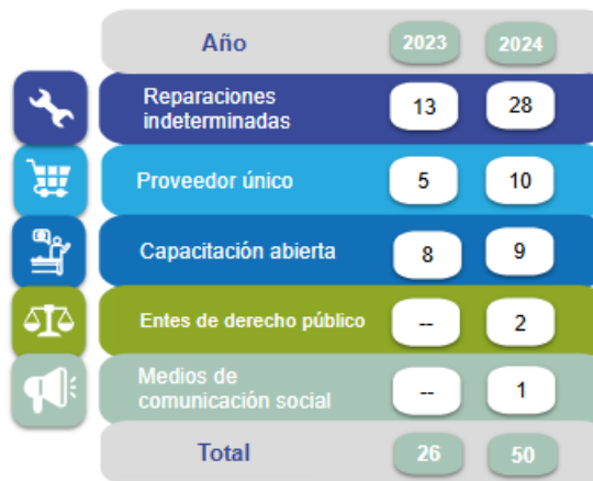
Figura 2. Procedimientos por excepción tramitados en SICOP entre 2023 y 2024.