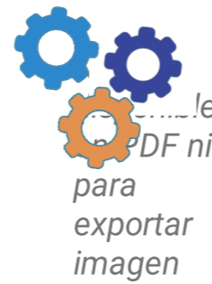
Figura N.º 2 Situación de la medición de costos de programas, actividades y productos 1

MH y Mideplan trabajan en una guía y plantilla para el seguimiento de costos por área y servicios institucionales de forma mensual y anual.