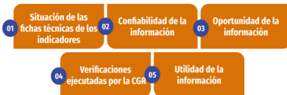
Figura n.º 1: Atributos de la calidad de la información auditada