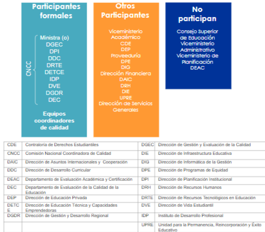
Figura 3 Análisis de partes involucradas en el SNECE