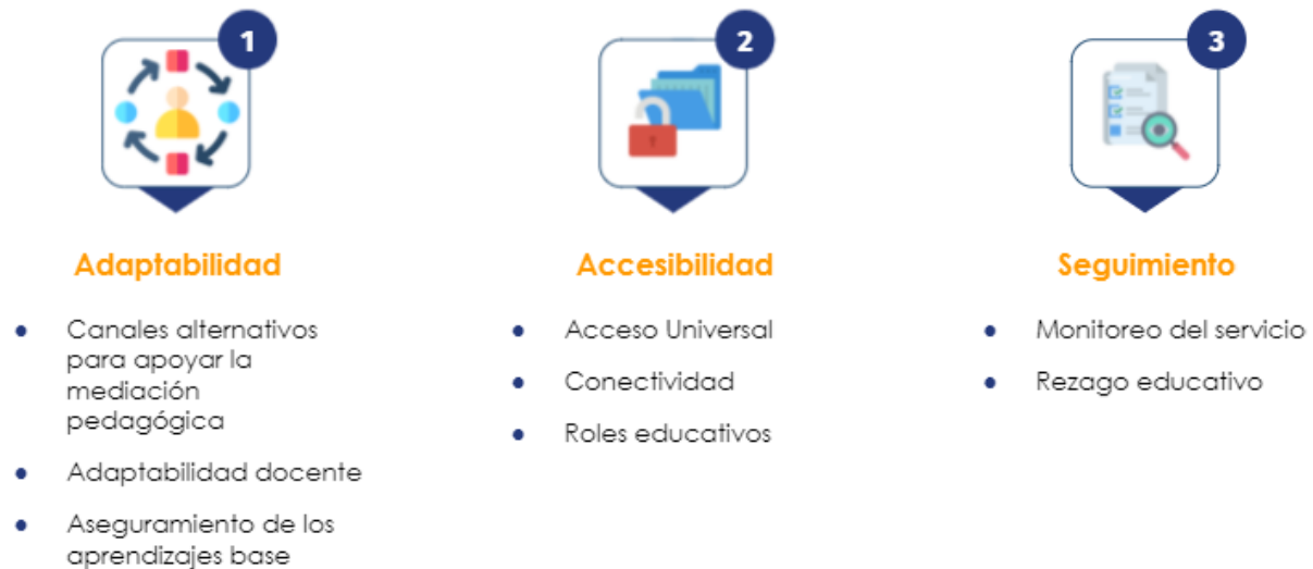
Figura N° 1 Elementos para la adaptabilidad, accesibilidad y seguimiento